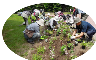
一年草花壇の植栽